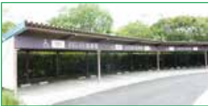
はなみずき駐車場