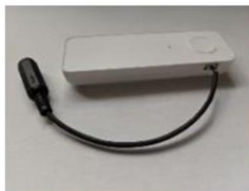
図2 スイッチテレコール本体