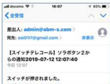
図4 メール受信画面