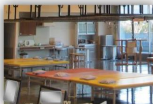
プラットフォーム

プラットフォームでは、作業療法士が関節可動域訓練を行うほか、足を伸ばして座った状態で移動する練習や、両腕を使ってお尻を持ち上げる push up の練習などを行います。デルトイドエイド・サンディングでは肩や腕の筋力を鍛える運動をします。手指巧緻性器具では、箸・スプーンの練習や手指の細かい動きの練習を行います。