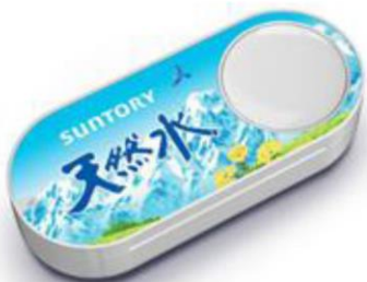
図1 アマジンダッシュボタン