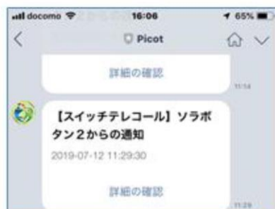
図5 LINE 受信画面