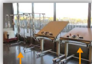
デルトイドエイドとサンディング